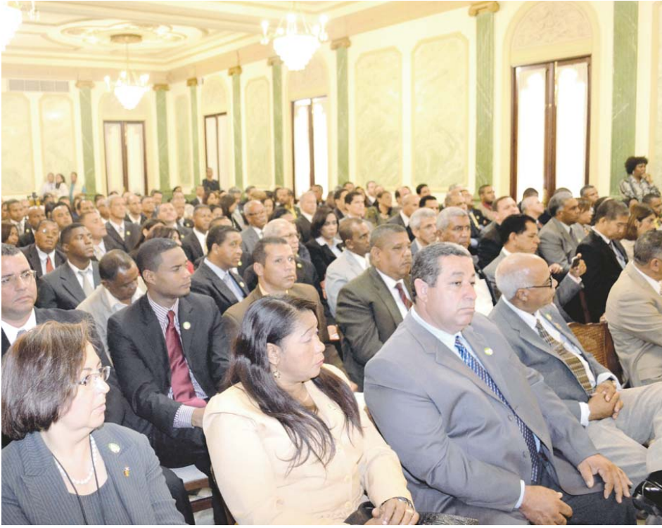
Público que asistió a la actividad.