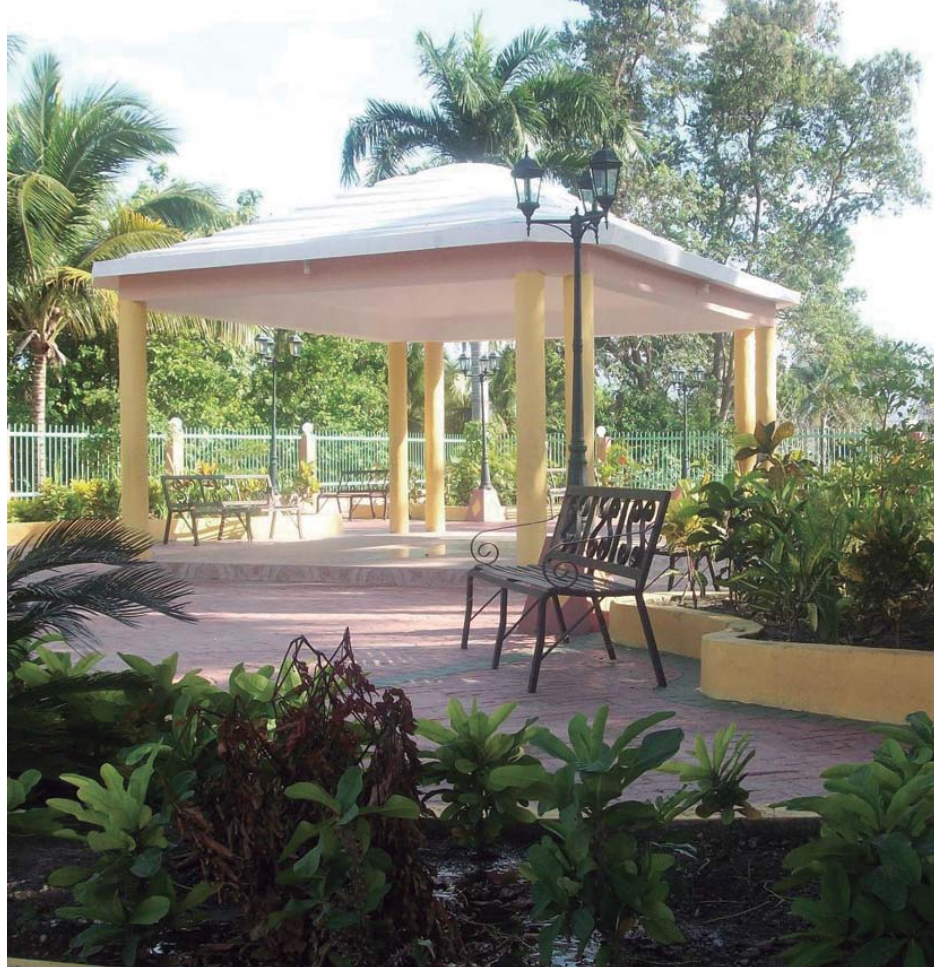
Vista del parque inaugurado.