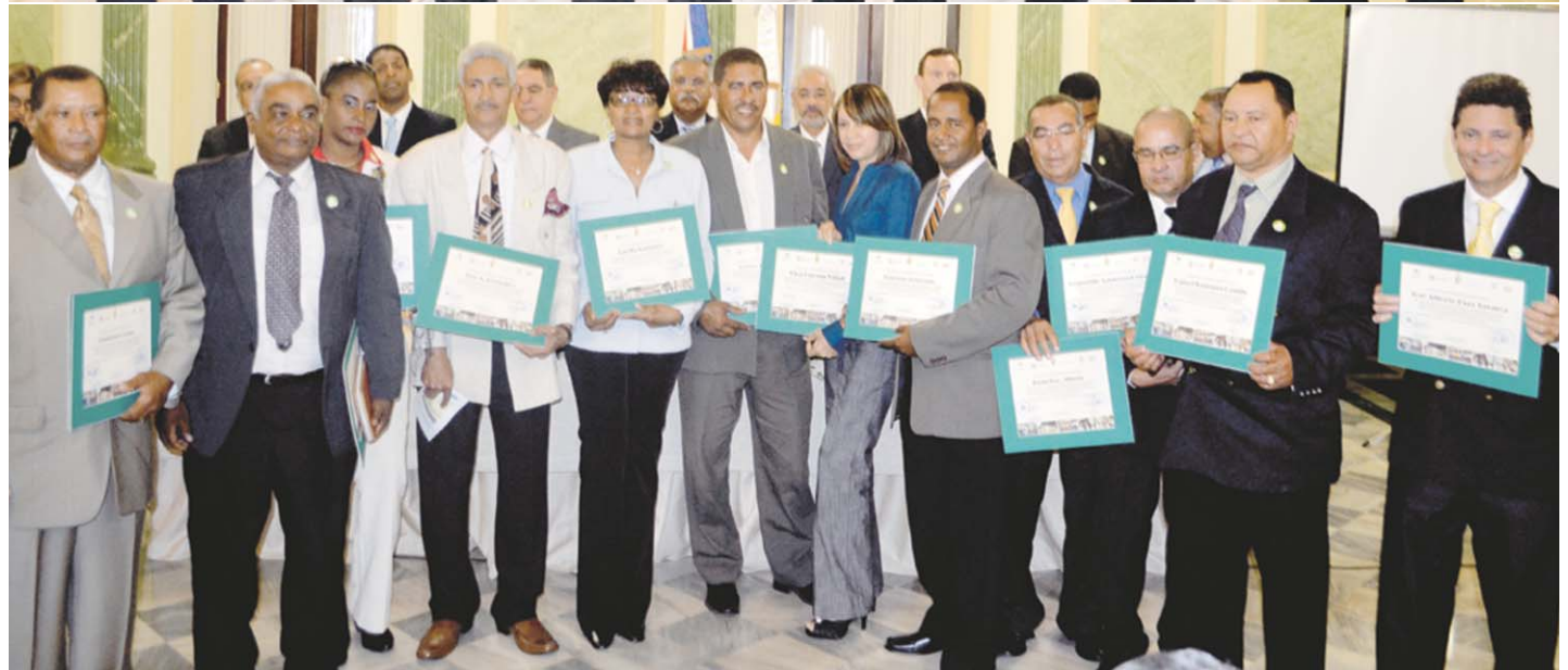
Parte de los técnicos graduados y certificados por FEDOMU y otras instituciones gubernamentales.

una revolución y que en lo que atañe a FEDOMU, están conscientes que la modernidad requiere de nuevos funcionarios municipales que sean “emprendedores sociales” capaces de crear y gestionar redes inter-organizativas en las que participan tanto organizaciones públicas como de la sociedad”. “Funcionarios que promuevan la experimentación y la innovación social para dar respuesta a los problemas y las necesidades sociales”.