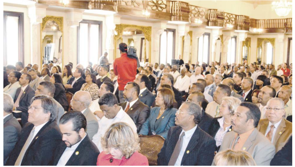
Público asistente en el acto organizado por el Palacio Nacional.