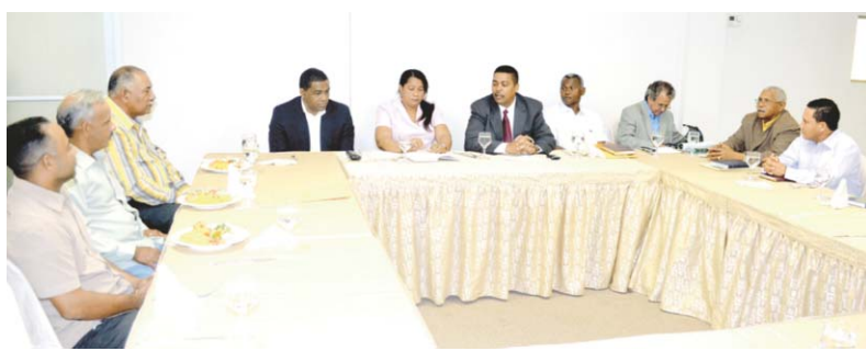
Vistas de la reunión realizada.

Como resultado de estos acuerdos, el próximo miércoles 15 de marzo, a las 10:00 a.m., la Mancomunidad Municipal para el Desarrollo de la Franja Oriental del Cibao Sur celebrará una rueda de prensa, en la sede nacional de