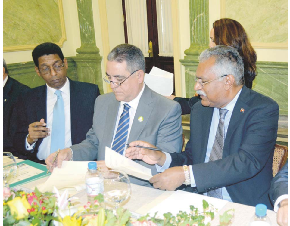
Momento de la firma de convenio de las instituciones participantes.