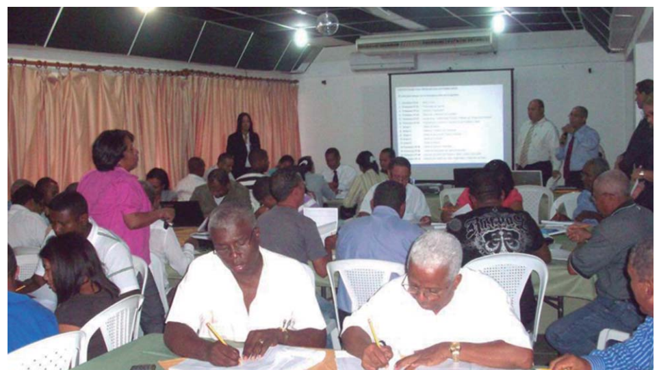
Participantes en uno de los talleres.