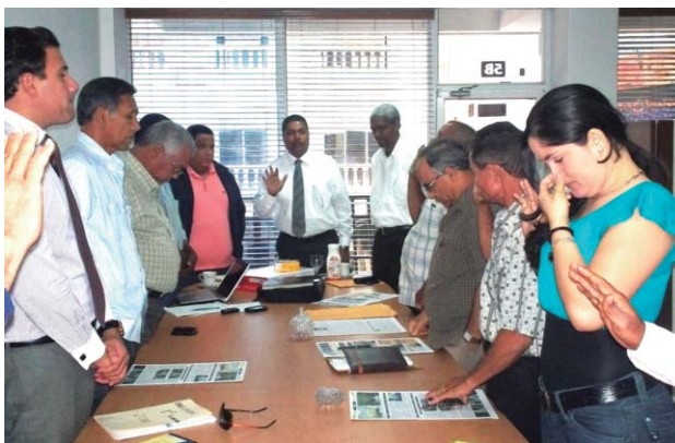
El director ejecutivo de Fedomu, junto a regidores y autoridades municipales de Estebanía de Azua durante la solución del conflicto.