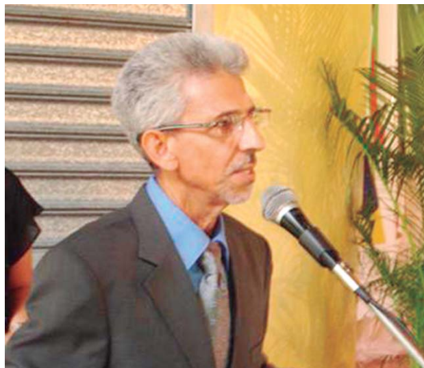
Pablo Batista, alcalde del municipio de Sabana Iglesia.

Tal como fuera consensuado en Asamblea Ciudadana el día 11 de mayo de 2011, adoptamos como Visión Estratégica de Desarrollo del Municipio la siguiente: