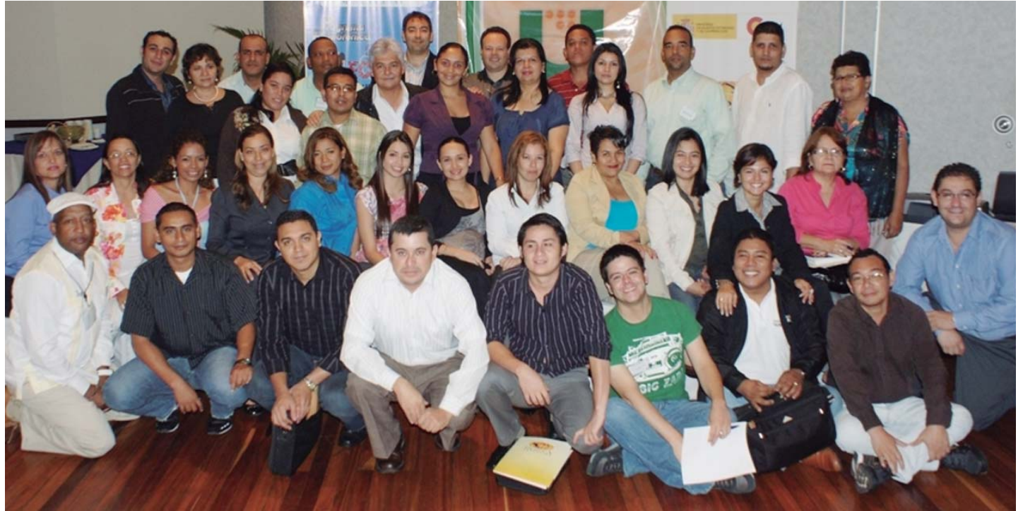
Comunicadores de Centroamérica y República Dominicana.

En la Red Regional de Comunicadores Municipales se convirtió en una realidad a partir de 2010. Formada principalmente por los responsables de comunicación de las asociaciones nacionales de municipios, la Red ha sido