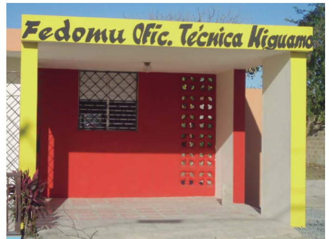
Nuevo local de la Asociación de Municipios Región Higuamo.