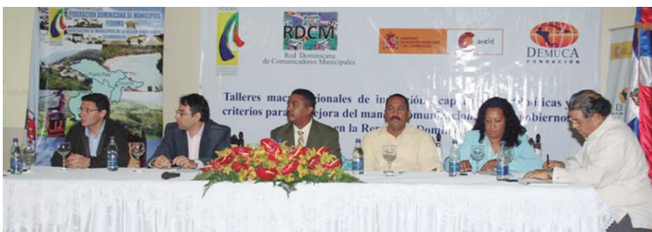
Mesa principal de uno de los encuentros regionales de la RDCM.