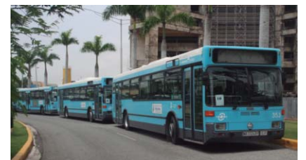
Parte de los autobuses entregados por FEDOMU.

nación de los señalados autobuses en su empeño de contribuir al desarrollo sostenido de los gobiernos locales dominicanos. La junta directiva de la entidad, mediante resolución, distribuyó los autobuses en 5 por regiones los cuales fueron sorteados en cada una de ellas entre los ayuntamientos interesados en utilizarlos en acciones comunitarias en favor sus municipios.