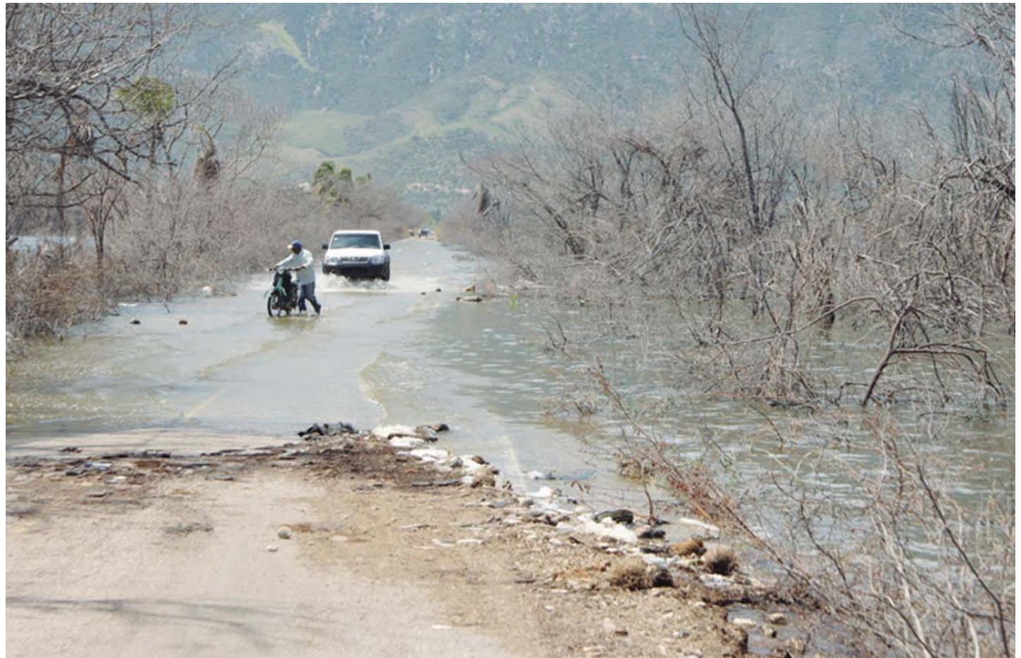
Oficinas sepultadas por la crecida del Lago Azuei.

En muchos programas de radio y de televisión dijimos que debíamos tener cuidado al decir que el incremento del nivel del lago Enriquillo se debía fundamentalmente a los aportes del río Yaque del Sur, y al deterioro de las obras hidráulicas que sirven de control de avenidas en la zona, porque eso no se corresponde con el patrón hidrogeológico regional, ya que si se desviara por completo el río Yaque del Sur, el lago seguiría subiendo en la misma proporción en que los caudales superficiales y subterráneos regionales si-