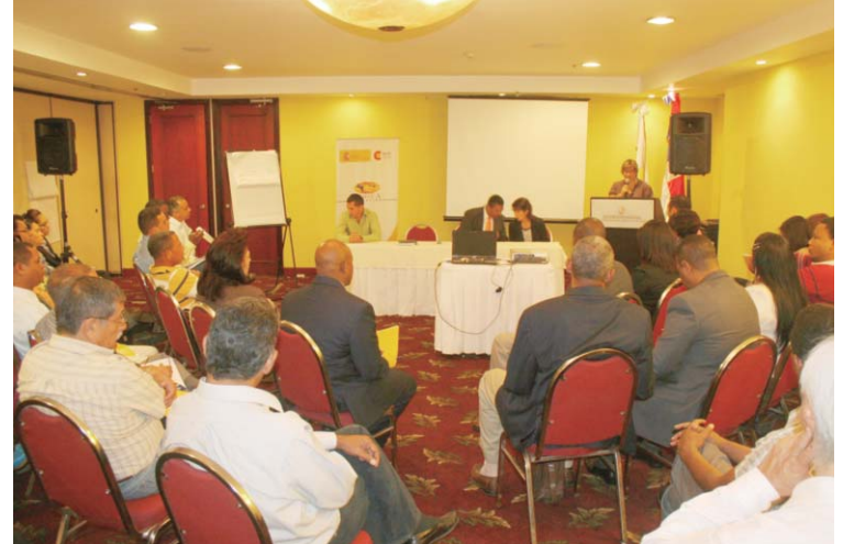
Participantes en el taller

realizado conjuntamente por la Comisión Económica para América Latina y el Caribe (CEPAL) y la Organización Internacional del Trabajo (OIT), se advierte un aumento del desempleo urbano que, para 2009, se situaba cerca del 8.5% de la población económicamente activa, lo que equivalía a que más de dieciocho millones de personas no encontraban trabajo en el mercado laboral urbano latinoamericano. Dentro de ese porcentaje se encuentran quienes han perdido el trabajo por la crisis, y aquellos que están en condiciones de incor-