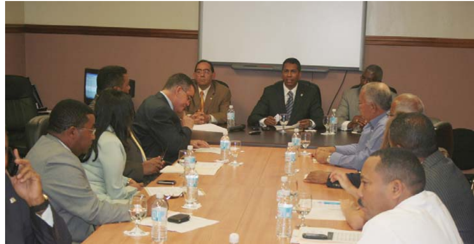
Diputados de la comisión de justicia intercambian impresiones con autoridades de Fedomu.

En el artículo 4, que se corresponde con el artículo 3 del proyecto bajo estudio, sugerimos decir "las sentencias dictadas por los tribunales de orden judicial" a fin de no utilizar la expresión "órganos jurisdiccionales" para lograr una mejor redacción. Preferimos en la parte final no decir "indemnizaciones" por cuanto la condenación al pago de una deuda no es una indemnización, sino el reconocimiento judicial al pago de una deuda. Por eso decimos "los pagos de obligaciones contenidas en sentencias", que deberán figurar en sus respectivos presupuestos. Para el caso de los ayuntamientos, especificamos que "dicha partida, en el caso de los ayuntamientos, podrá ser incluida con cargo al 40% destinado a inversión". De esta manera, no se obliga a los