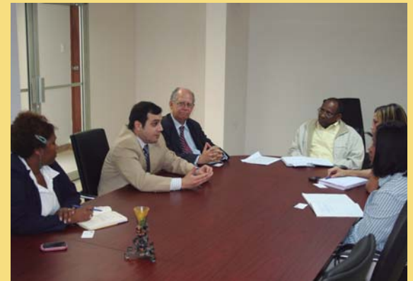
Vista de los participantes en el encuentro.

Otra vertiente de Parlocal es la investigación comparada que se está llevando a cabo acerca de las experiencias en democracia participativa de 36 municipios de los tres países socios, entre los que diez de los municipios analizados son españoles. Dicho estudio permitirá extraer conclusiones sobre la evolución e impacto que los presupuestos participativos están teniendo en municipios donde se están llevando a cabo.