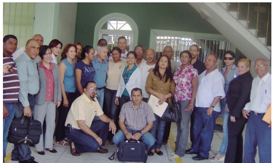
Representantes de diversos municipios de la región Valdesia participantes en la capacitación.

Los temas impartidos durante el citado programa fueron: "Introducción a los municipios y los gobiernos locales a la luz de la Ley 176-07 y la nueva Constitución", "Notiones básicas de administración pública, servicio civil y carrera administrativa", "Diseño organizacional, clasificación, valoración y remuneración de cargos", entre otros.