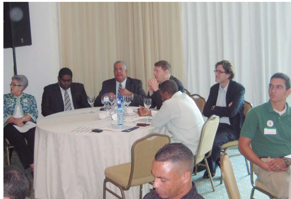
Parte del público asistente)