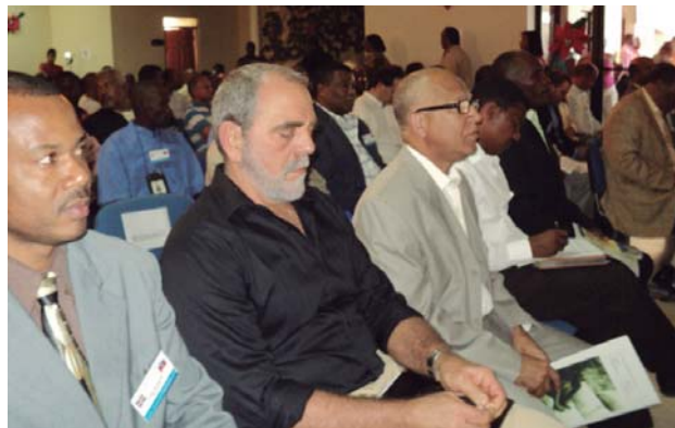
Autoridades municipales de la frontera durante el encuentro.

También asistieron el señor embajador de Francia,