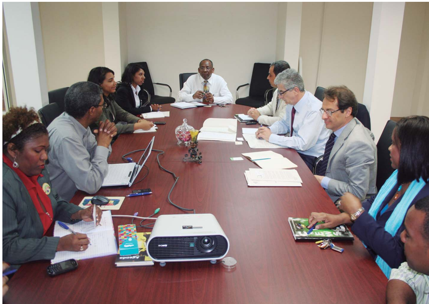
Participantes en el encuentro entre la delegación italiana y personal de Fedomu.