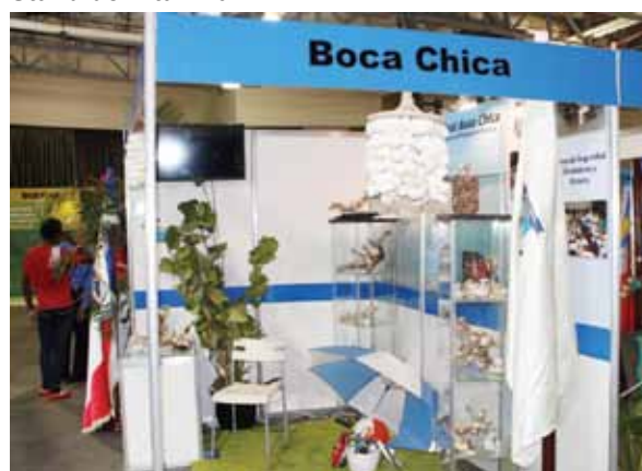
Stand de Boca Chica.