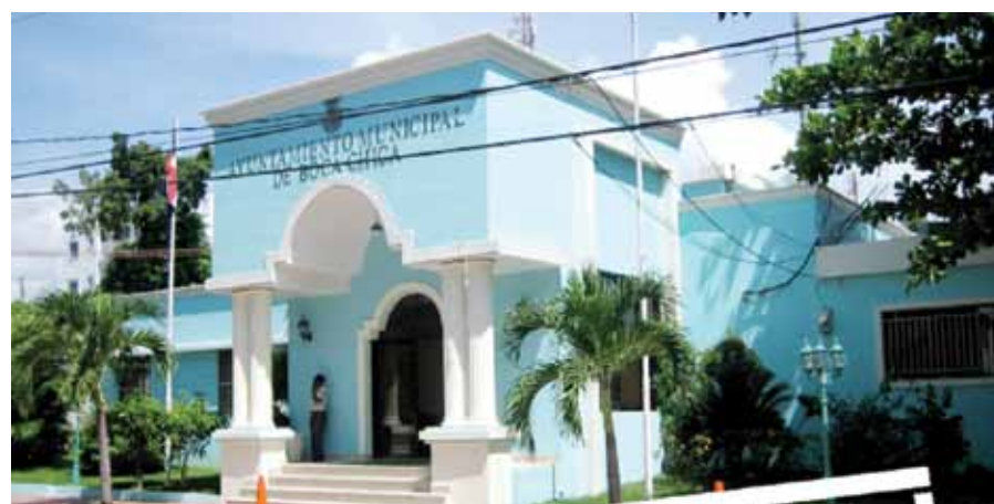
Edificio del ayuntamiento de Boca Chica.

reconoció en nombre de la comunidad el trabajo que la alcaldía ha realizado en el sector Altos de Chavón y en todo el municipio de Boca Chica.