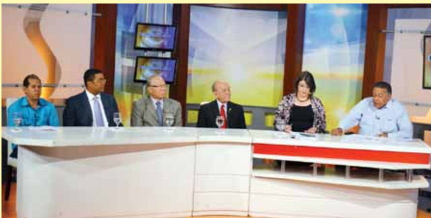
Panel debate sobre la reforma de la Ley Municipal, en el programa Uno más Uno.