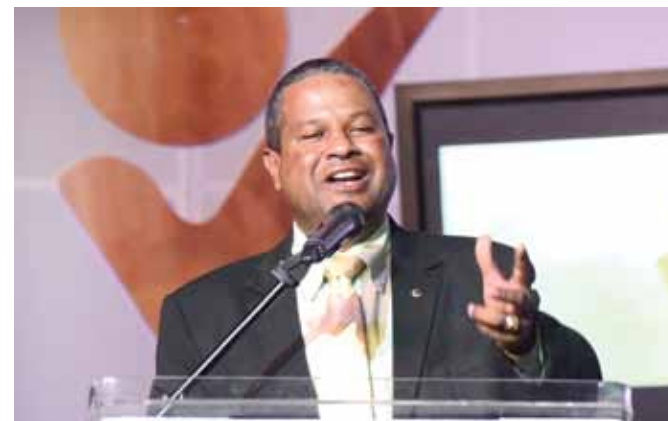
Tony Echavarría, alcalde de San Pedro de Macorís.