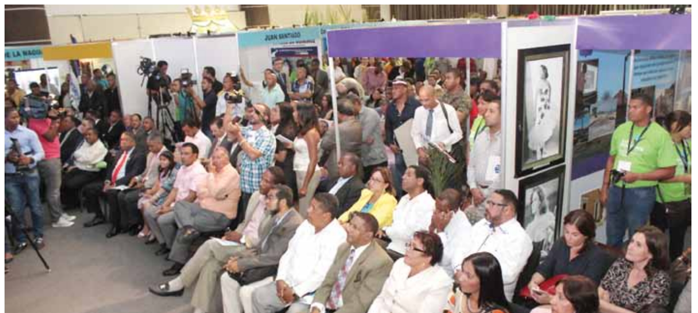
Alcaldes, alcaldesas y público participan de la Expo Municipios 2014.

Expo Municipios, en su segundo día, fue transmitida en vivo por los integrantes del programa Sol de la Mañana, en donde Juan de los Santos, presidente de Fedomu y alcalde de Santo Domingo Este; Víctor D'Aza, director ejecutivo, y varios alcaldes y alcaldesas, así como los dirigentes de la Federación Dominicana de Distritos Municipales (Fedodim); Asociación Dominicana de Regidores (Asodore) y de Unión de Mujeres Municipalistas Dominicanas (Unmundo) tuvieron intervenciones con diversos temas de interés.