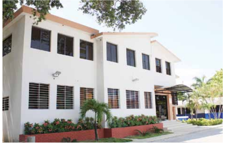
Local donde se encuentran alojadas las oficinas de la región Enriquillo de Fedomu.