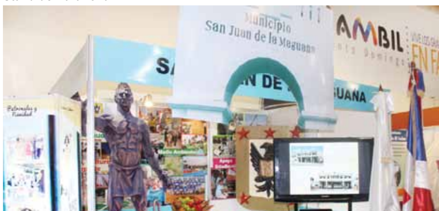
Stand de San Juan de la Maguana.