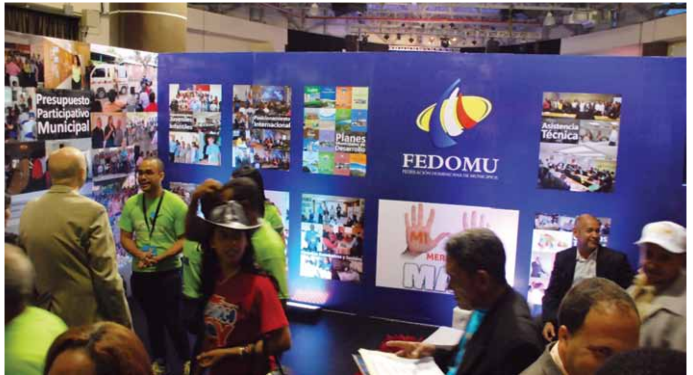
Stand de Fedomu.

San Juan de la Maguana es un municipio rico en cultura. El ayuntamiento de este municipio ha decidido combinar la arquitectura y la cultura y a través de este programa que ha revalorizado los espacios de uso público en la ciudad, cuyo valor agregado consiste en el rescate de 16 plazas o parques públicos diseminados en todo el municipio a los cuales les ha conferido en su diseño una propuesta cultural dedicada a personalidades de la vida pública del municipio, realizado así