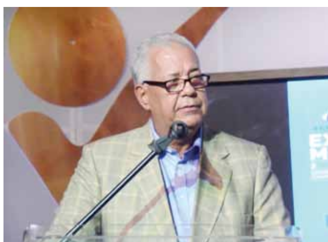
Nelson -Chacho- Landestoy, alcalde de Baní.

recho a la participación, se han desarrollado 5 gestiones de los Ayuntamientos Infanto-Juveniles en Baní, espacios donde más de 50,000 niños, niñas y adolescentes han participado como votantes para elegir sus autoridades municipales infanto-juveniles.