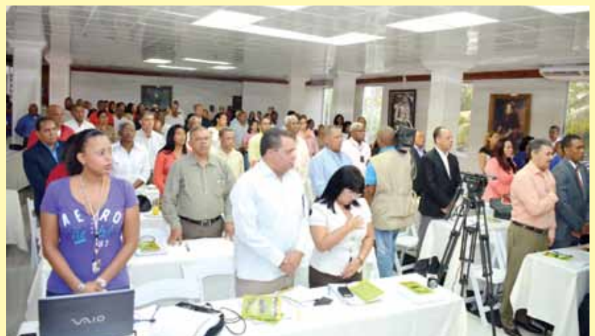
Parte de los asistentes al seminario organizado por Asodore y la LMD.