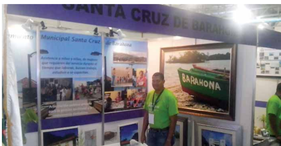
Stand de Barahona.

La adquisición del inmueble para la instalación del Centro Universitario Regional de la Universidad Autónoma de Santo Domingo en San Pedro de Macorís, es una verdadera oportunidad de desarrollo para más de 600 estudiantes provenientes de distintos lugares de la provincia. El Programa de Becas Universitarias y Técnicas ha contribuido con una población de 1,017 nuevos estudiantes en el período 2005 a 2013, de los cuales 443 son profesionales universitarios y 684 son técnicos.