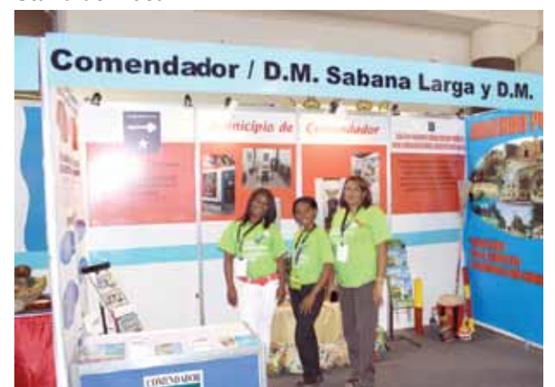
Stand de Comendador.