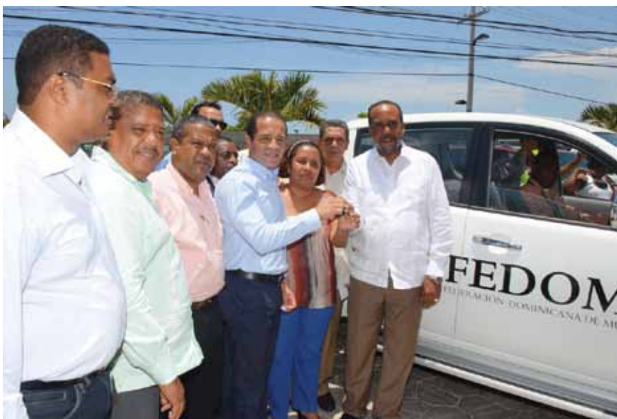
Momento de la entrega de las llaves de una camioneta que será utilizada en la región Enriquillo.

Las instalaciones de Asomure cuentan con oficinas de Asesoría, Asistencia y Coordinación Técnica. También posee un amplio salón para desarrollar actividades y otro para reuniones ejecutivas.