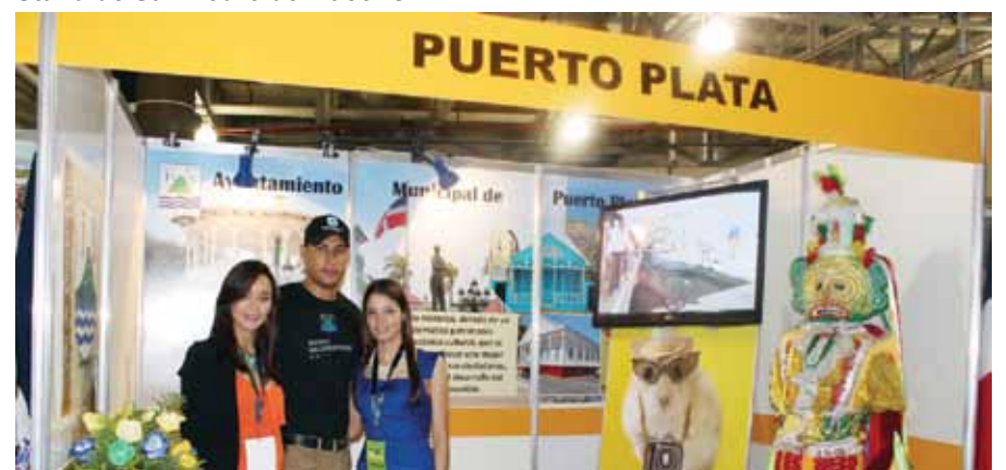
Stand de Puerto Plata.