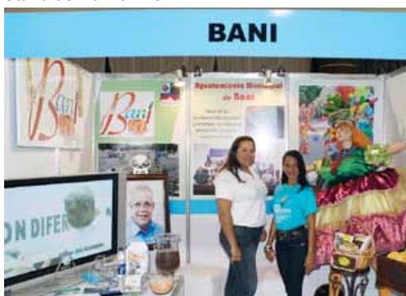
Stand de Bani.