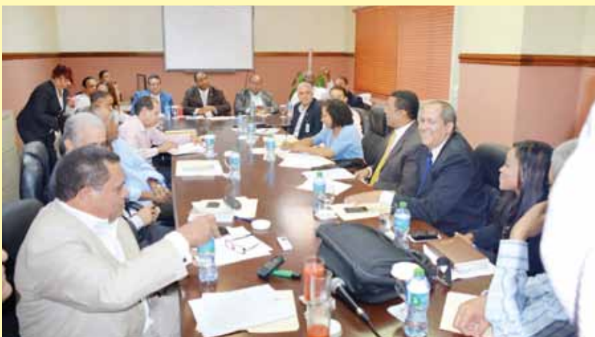
Comisión de Fedomu, encabezada por Víctor D'Aza, se reúne con la Comisión Permanente de Interior y Policía de la Cámara de Diputados, para discutir sobre el proyecto de ley que crea la Dirección General de los Bomberos.