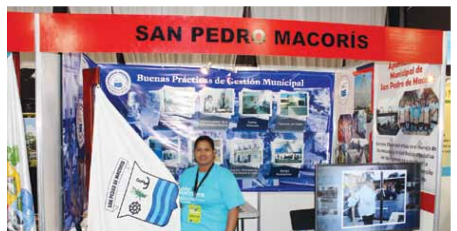
Stand de San Pedro de Macorís.