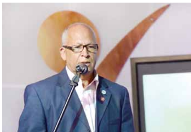
Luis Minier, alcalde de Comendador.