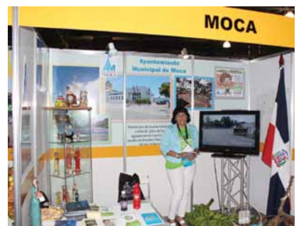
Stand de Moca.