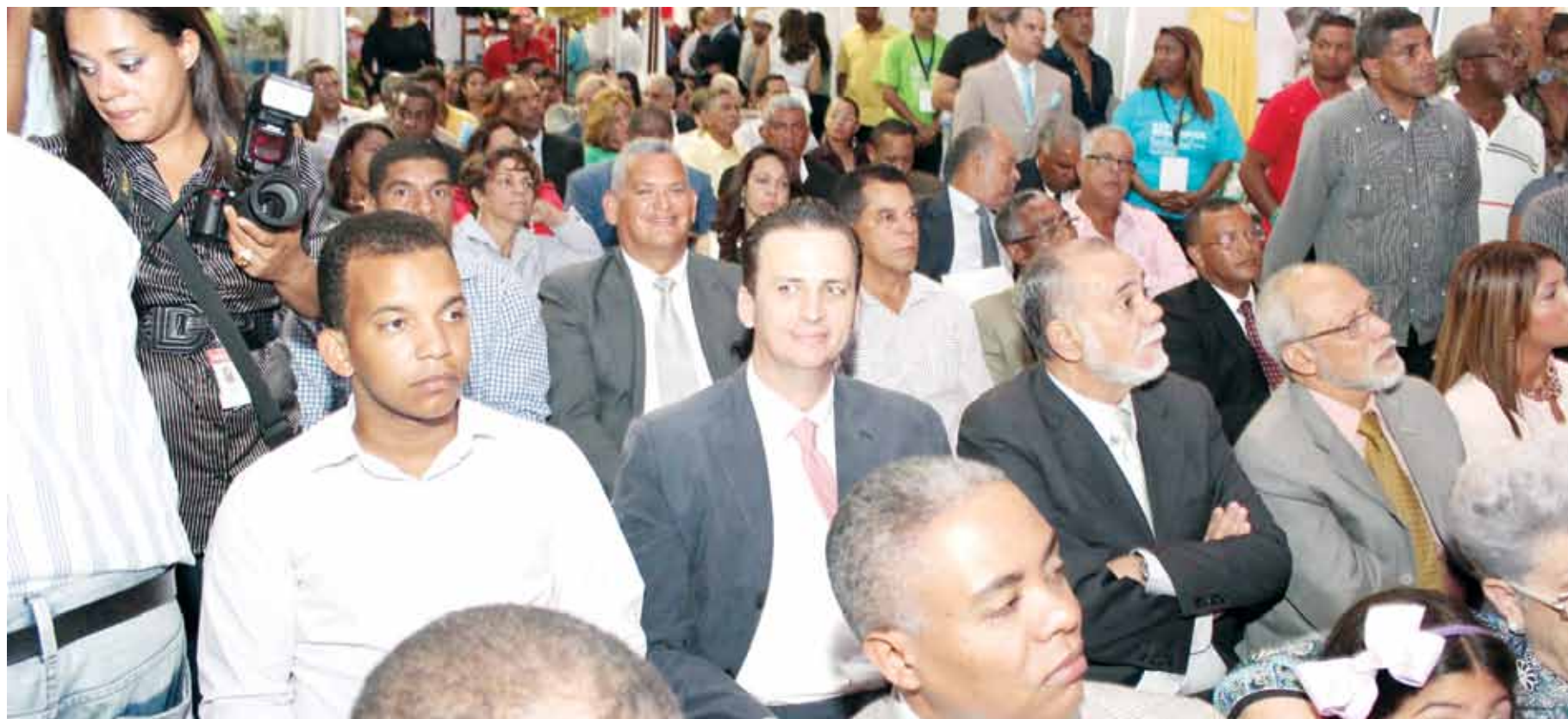
Parte de las miles de personas que acudieron a presenciar los atractivos de la Expo Municipios, en Plaza Sambil.