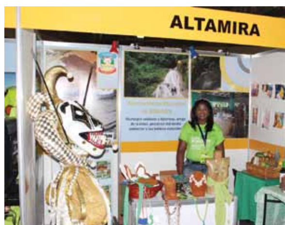
Stand de Altamira.