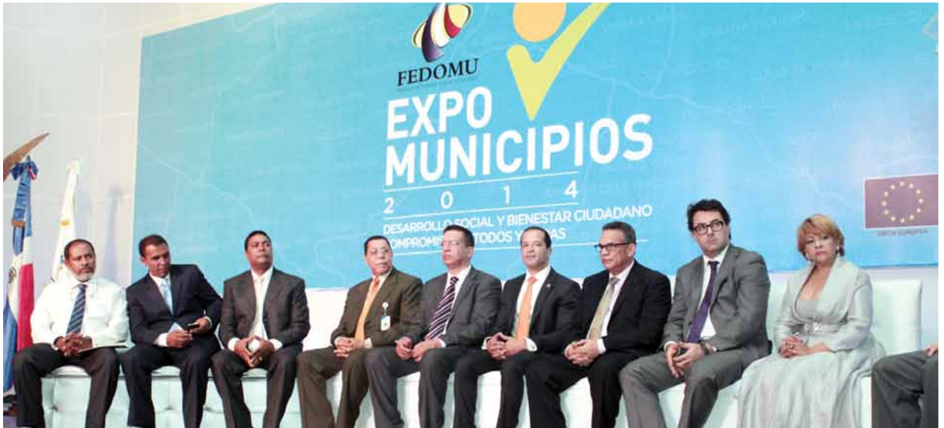
Mesa de honor encabezando la apertura de Expo Municipios 2014.