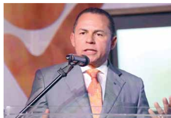
Remberto Cruz, alcalde de Moca.