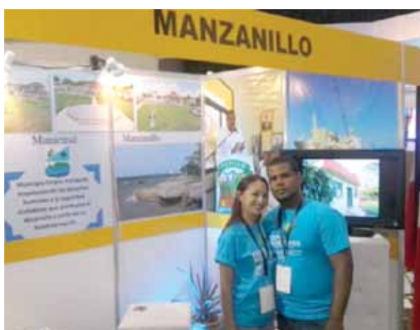
Stand de Manzanillo.

Exhortó a no dejar que esas tendencias sean parcialmente enfrentadas solo por el Gobierno Central y otros sectores, por lo que pidió empezar a demandar y a proponer, a mejorar y aplicar la planificación y la gestión territorial en todos y cada uno de los municipios del país.