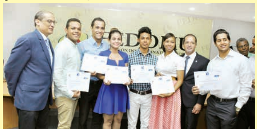
La Federación Dominicana de Municipios (Fedomu), la Facultad Latinoamericana de Ciencias Sociales (Flacso) y la Universidad de Ryerson, Canadá entregaron pergaminos del curso Certificado: "Liderazgo Juvenil y Gestión Municipal", a jóvenes miembros de la Red de Asesores de Ayuntamientos Juveniles e Infantiles (Redaji) y representantes de las comisiones electorales de los municipios beneficiarios del proyecto "Expansión Inicativas Locales Ayuntamientos Juveniles e Infantiles (AJI's)".