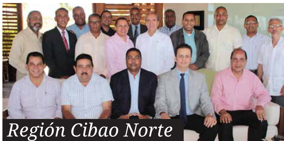
Región Cibao Norte

integrarse aún más a las tareas correspondientes a sus funciones como atribuciones de sus respectivos municipios, así como lo hace FEDOMU en todo el país.