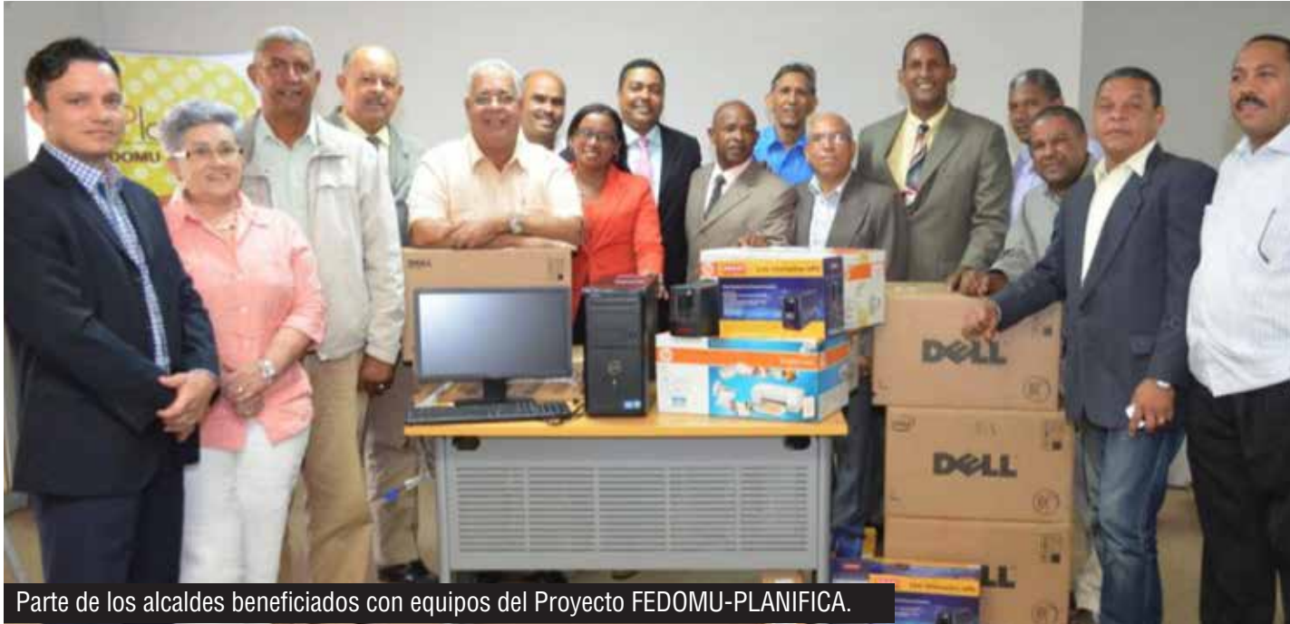
Parte de los alcaldes beneficiados con equipos del Proyecto FEDOMU-PLANIFICA.

Los ayuntamientos beneficiarios en la primera etapa del Proyecto FEDOMU-PLANIFICA, recibieron equipos y mobiliario para la puesta en funcionamiento de su Oficina Municipal de Planificación y Programación.