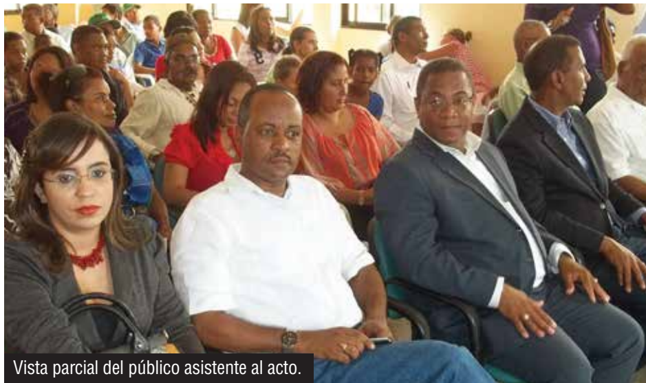
Vista parcial del público asistente al acto.